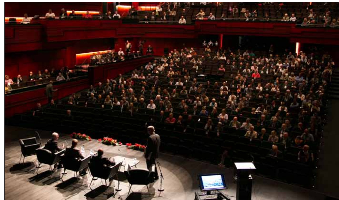
Plenum í Eldborg. Allir fjórir salir Hörpu voru notaðir fyrir Via Nordica ráðstefnuna.