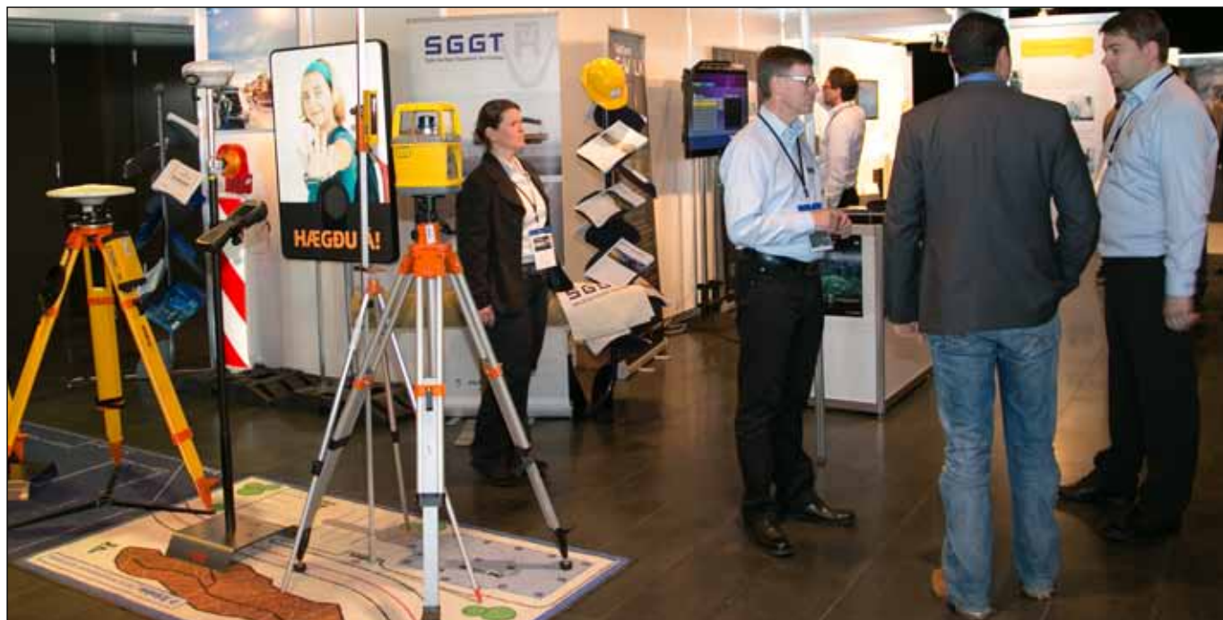
Einn af fjölmörgum básum í sýningarsvæði Hörpu.

hlaut þau. Hæfnisverðlaunin, eða Competenceprisen, fóru einnig til Noregs, til Næringslivsríngin en þau samtök einbeita sér að því að koma á sambandi milli norrænu ríkjanna um að ráða ungt fólk til starfa í tækni- og verkfræðigreinum.