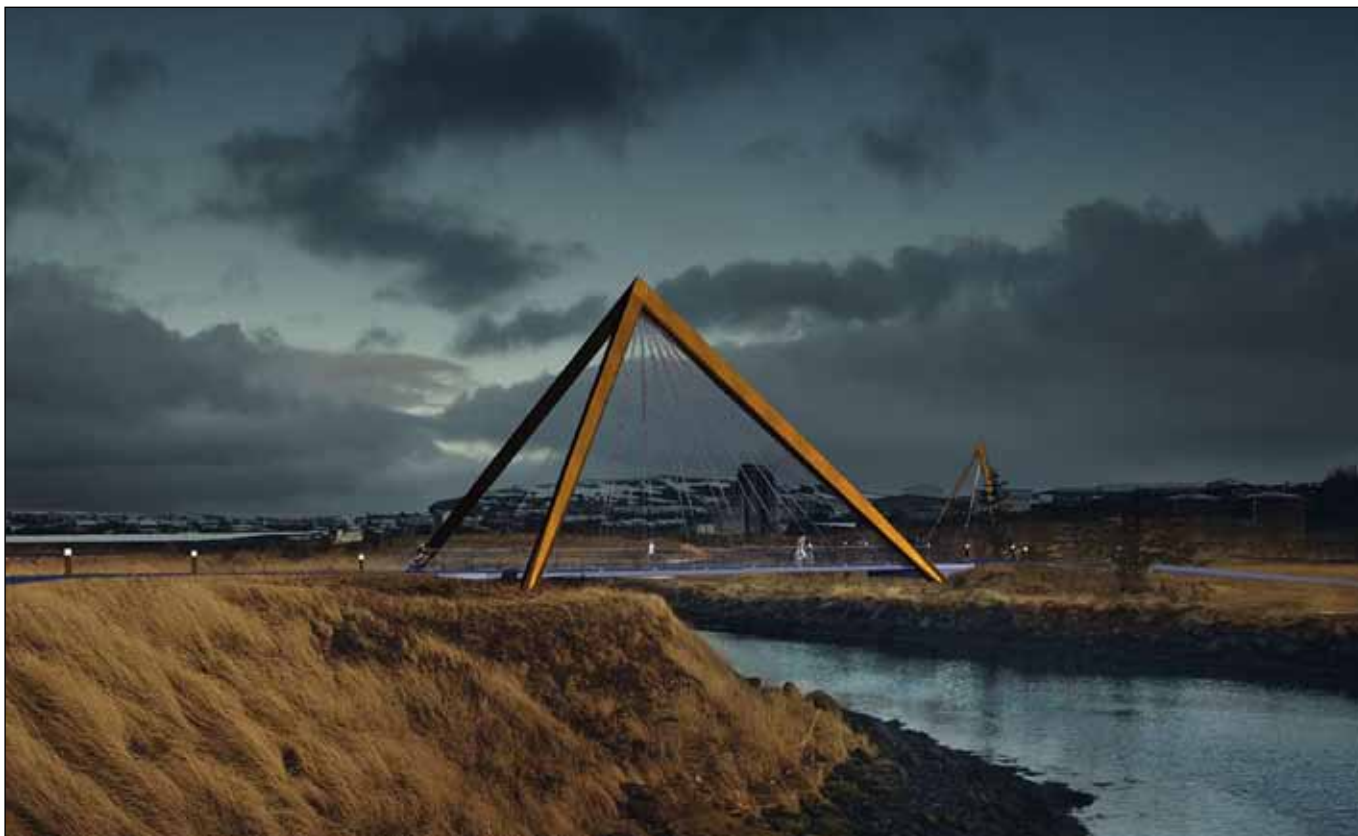
Vinningstillaga, göngu- og hjólabrýr yfir Elliðaárósa.