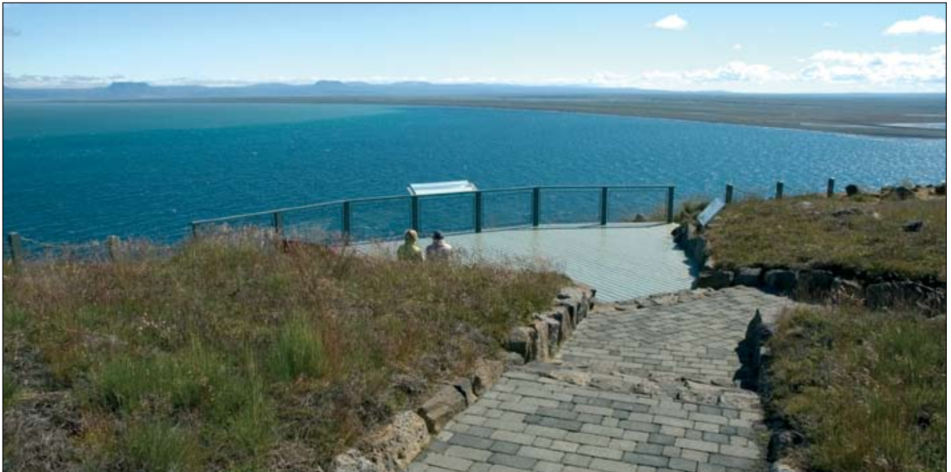
Áningarstaður Vegagerðarinnar við Norðausturveg (85) á Tjörnesi.