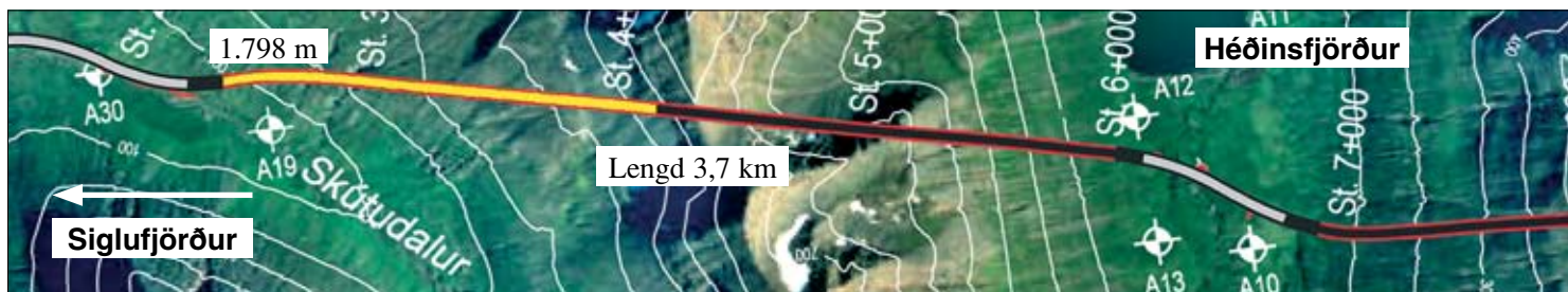
Staða framkvæmda við Héðinsfjarðargöng 11. júní 2007. Búið er að sprengja 1.798 m í Siglufrirði og 1.186 m í Ólafsfirði.

Samanlögð lengd ganga er nú 2.984 m sem er um 28,2% af heildarlengd.