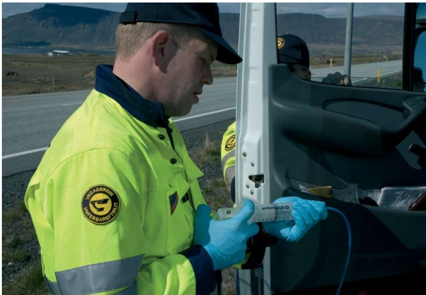
Umferðareftirlitsmaður tekur sýni af díselolíu.