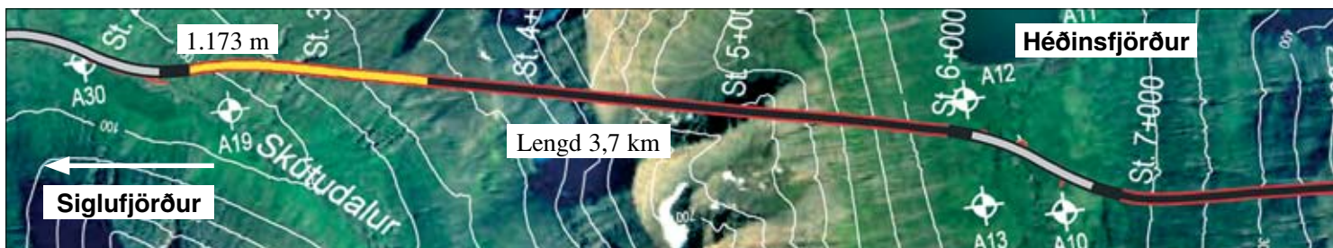
Staða framkvæmda við Héðinsfjarðargöng 25. mars 2007. Búið er að sprengja 1.173 m í Siglufirði og 992 m í Ólafsfirði.

Við kirkjugarðinn hefur undanfarna áratugi verið í gangi hægfara rof á árbakkanum. Á árabílinu 1960-1992 var rofið á móts við kirkjugarðinn 10-20 m en nokkru neðar er rofhráðinn meiri eða um 40 m á sama árabíli. Frá 1992 virðist heldur hafa dregið úr rofhráðanum. Rofið er hægfara við kirkjugarðinn og er ástæða þess sú að í norðurbakkanum er víða samlímdu sandstein eða móberg sem tekur ána talsverðan tíma að vinna á. Kirkjugarðurinn er að hluta varinn af móbergi og því gerlegt að verja hann með grjótvörn. Þegar móbergið verður farið á láta svo mikið undan að það fer að sjást á grjótvörninni mun þurfa að framlengja vörnina um 50 m upp að næsta móbergsnefi.