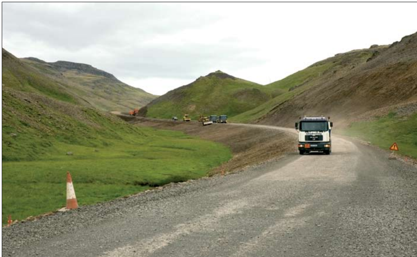
Vegagerð í Svínadal í ágúst 2006.