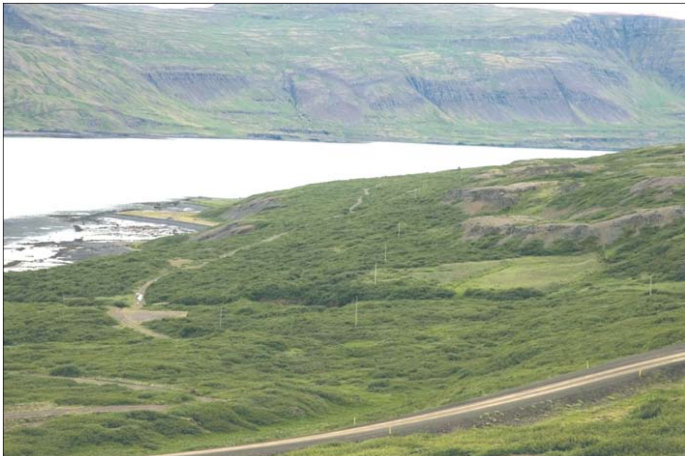
Porskafjörður og Teigsskógur. Myndin er tekin af Hjallahálsi.