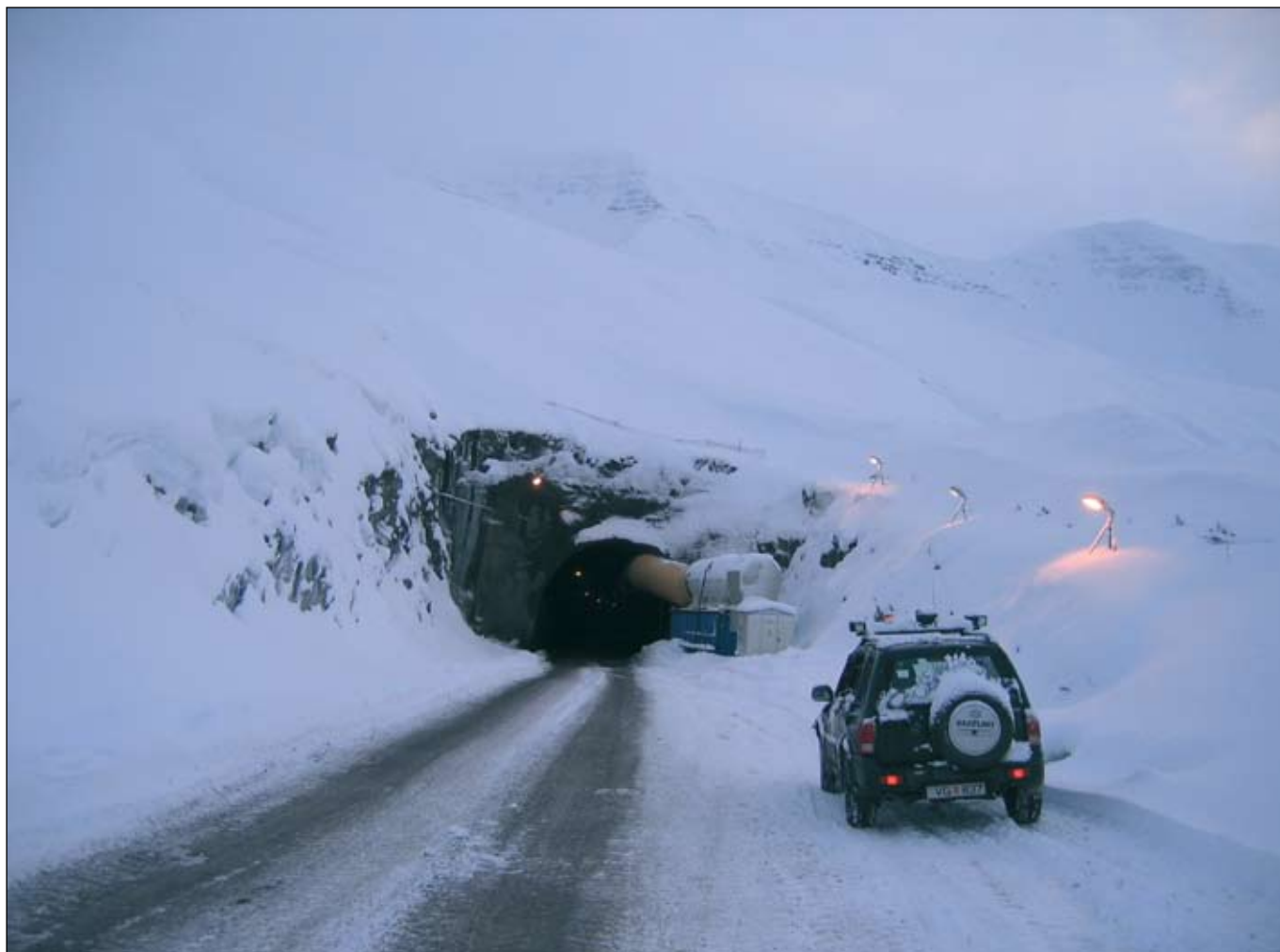
Gangamunni Héðinsfjarðarganga í Siglufirði 15. desember 2006.