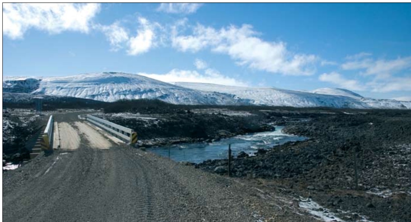
Hálsasveitarvegur (518) ofan við Húsafell. Brú á Hvíta.