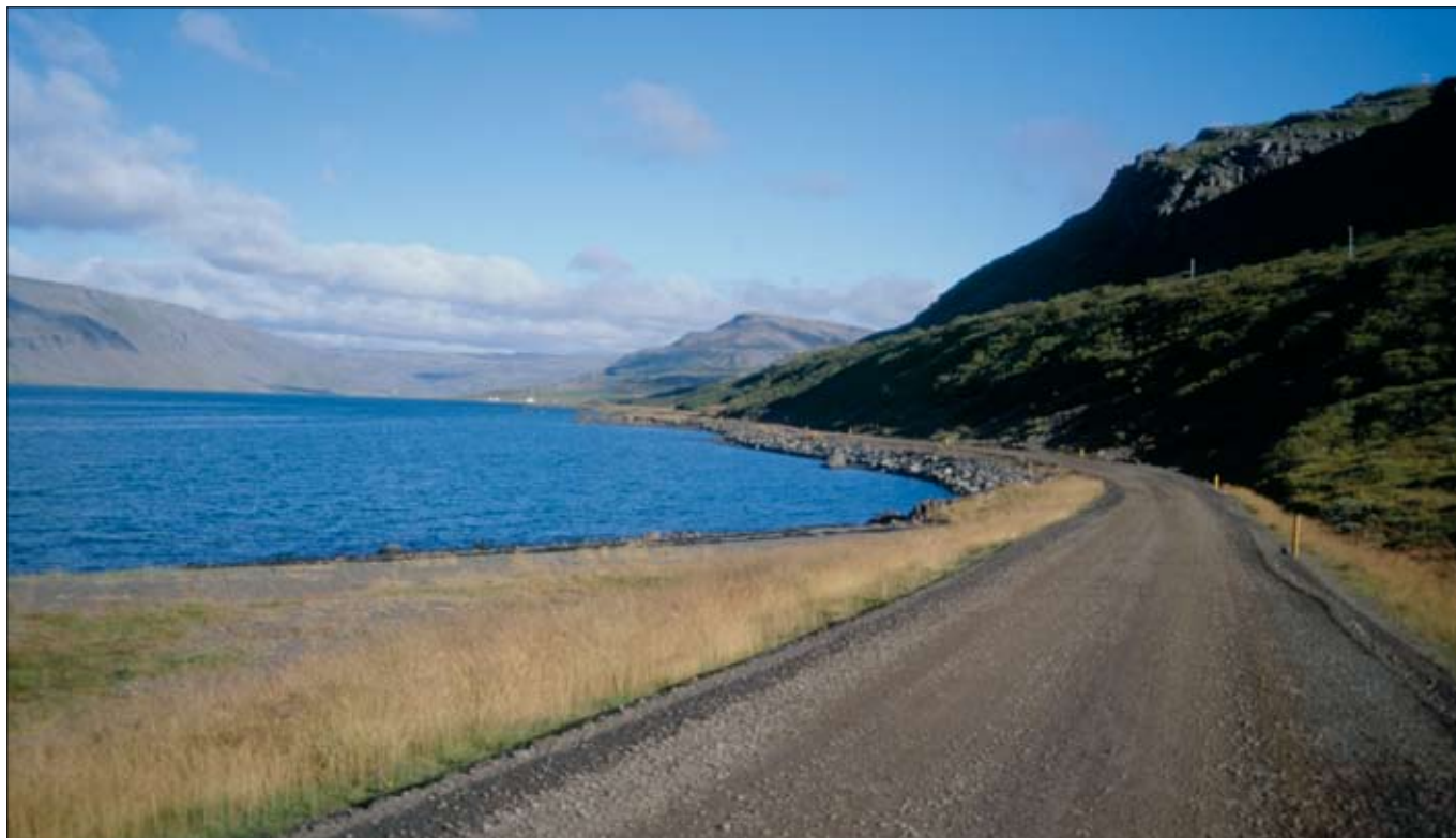
Í þessu blaði er auglýst útboðið Vestfjarðavegur (60), Skálanes-Eyri.