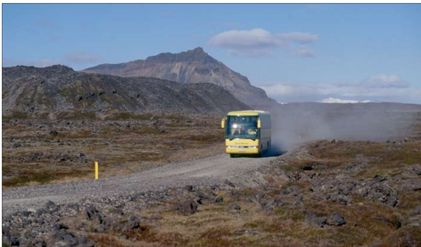
Útmesvegur (574) við Háahraun. Útboði kaflans frá Háahrauni að Hellu hefur verið frestað um viku.