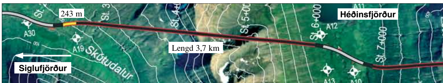
Staða framkvæmda við Héðinsfjarðargöng 30. október 2006. Samtals er búið að sprengja 243 m.