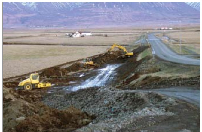
Framkvæmdir við vegamót Hringvegur (1) og Sauðárkróksbrautar (75). 31.01.06.