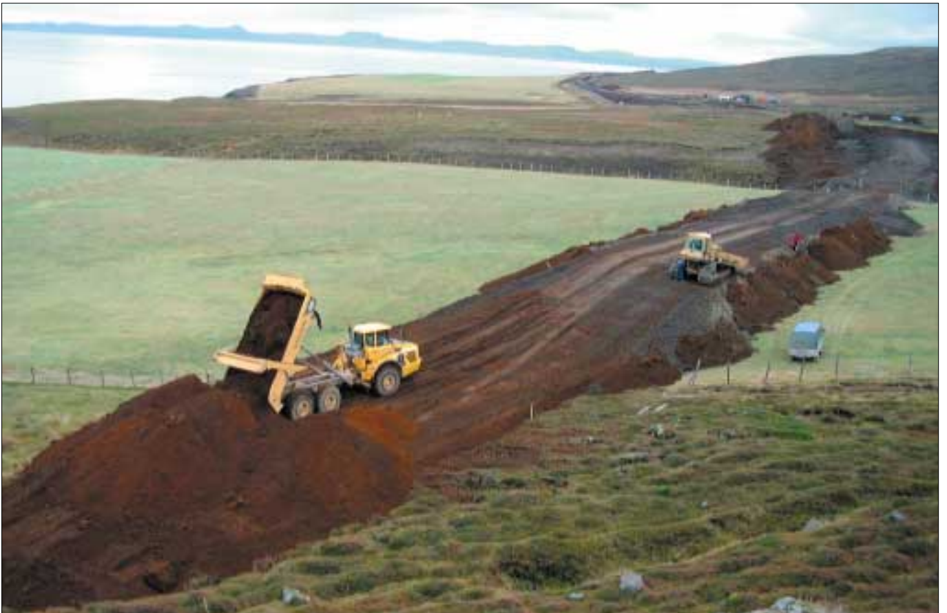
Norðausturvegur, Breiðavík - Bangastaðir, 10. október 2003. Verktaki er Árni Helgason, Ólafsfirði. Verklök verða í september 2004. Þá verður komið bundið slitlag frá Húsavík, um Tjörnes og Öxarfjörð að Arnarstöðum.