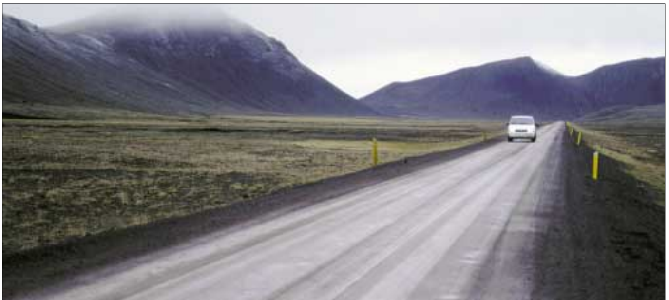
Hringvegur (1). Vegaskarð í baksýn. Endurbygging þessa vegarkafli var boðin út með auglýsingu í síðasta tölublaði. Sjá kort hér að ofan og frétt á forsíðu.