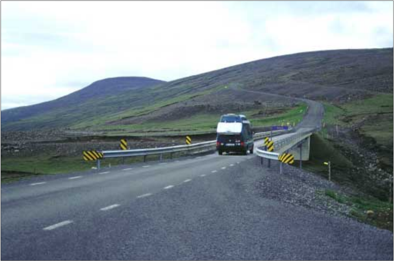
Hringvegur (1). Brú á Gilsá í Jökuldal og vegur upp Arnórstaðamúla í baksýn. Þetta verður síðast malarvegakaflinn á leiðinni frá Akureyri til Egilsstaða þegar þau verk sem nú hafa verið boðin út eru fullgerð. Vegarkaflinn er 5,2 km.