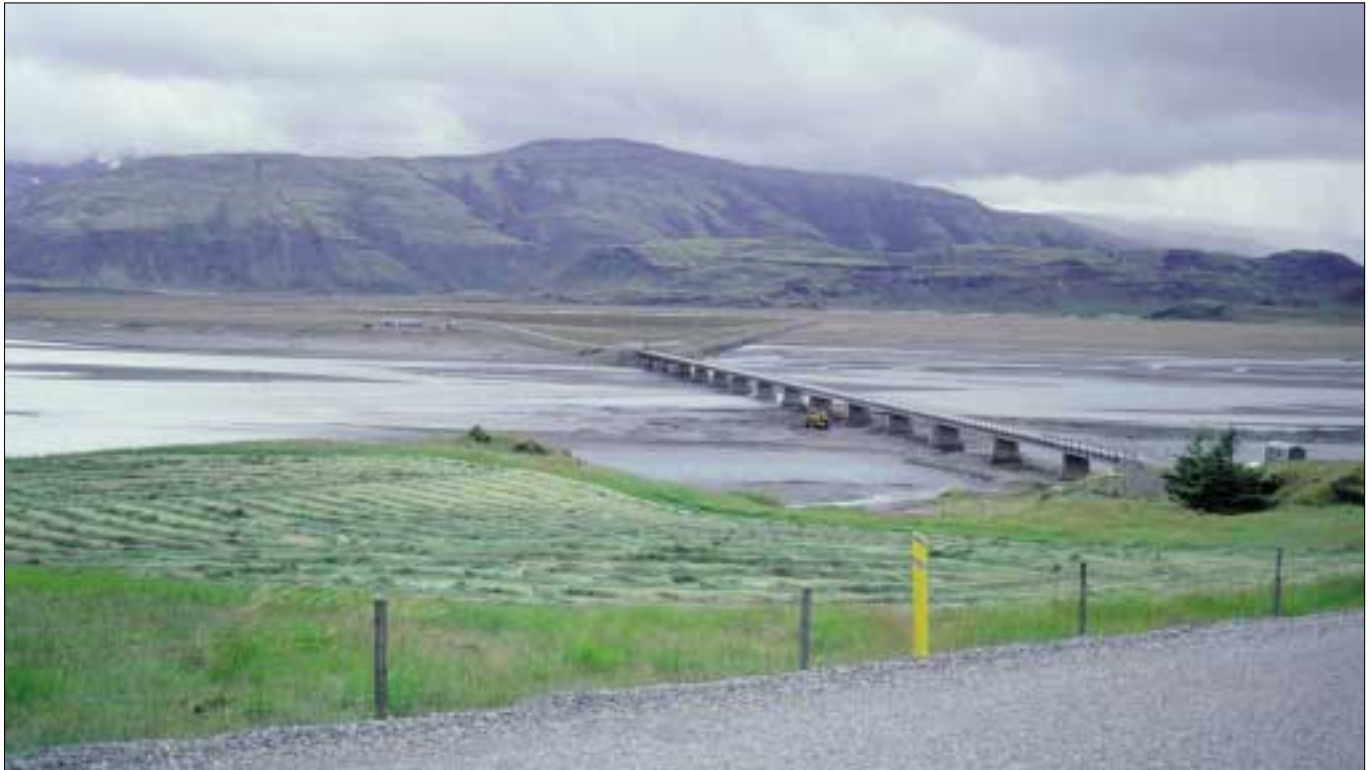
Hringvegur (1), brú yfir Jökulsá í Lóni. Í þessu blaði er auglýst útboð varnargarða neðan vegar. Mynd 19. júlí 2001.