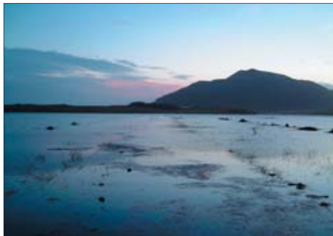
Flóð í Hvítá.