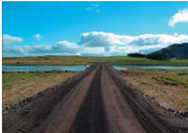
Nýr vegur með ræsi.