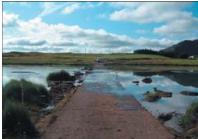
Steyp yfirfall frá fyrrihluta síðustu aldar. Lækurinn rennur frá hægri til vinstri.