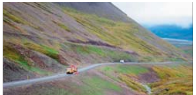
Á myndinni sést niður Bjarnadal, gamli vegurinn sést ofar í hlíðinni.