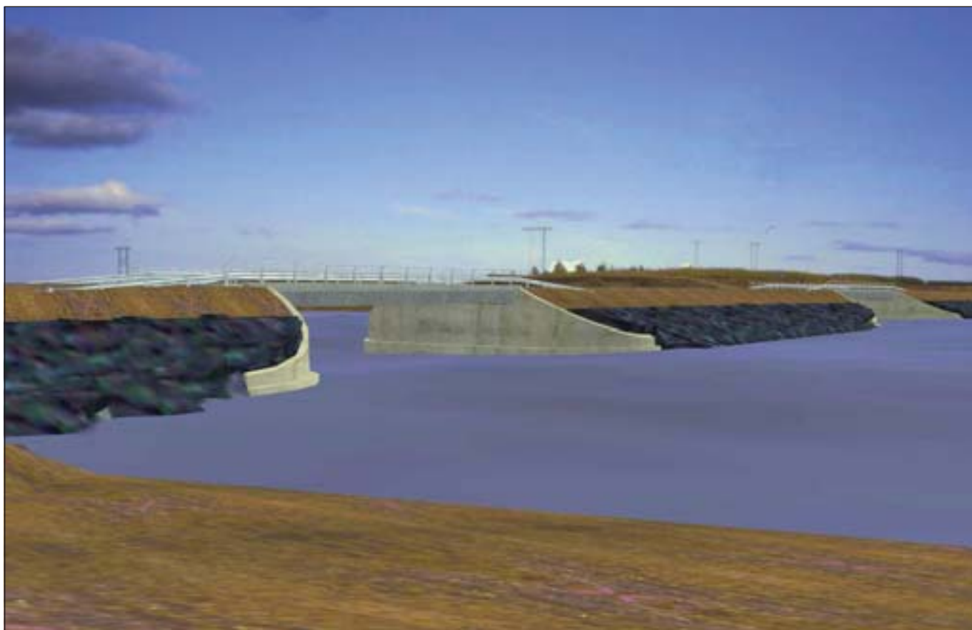
Nýjar brýr á Skaftá. Þær verða tvíbreiðar með gangbraut. Grjótvörn er á fyllingum til að verjast vatnavöxtum. Tölvumynd: brúardeild Vegagerðarinnar.