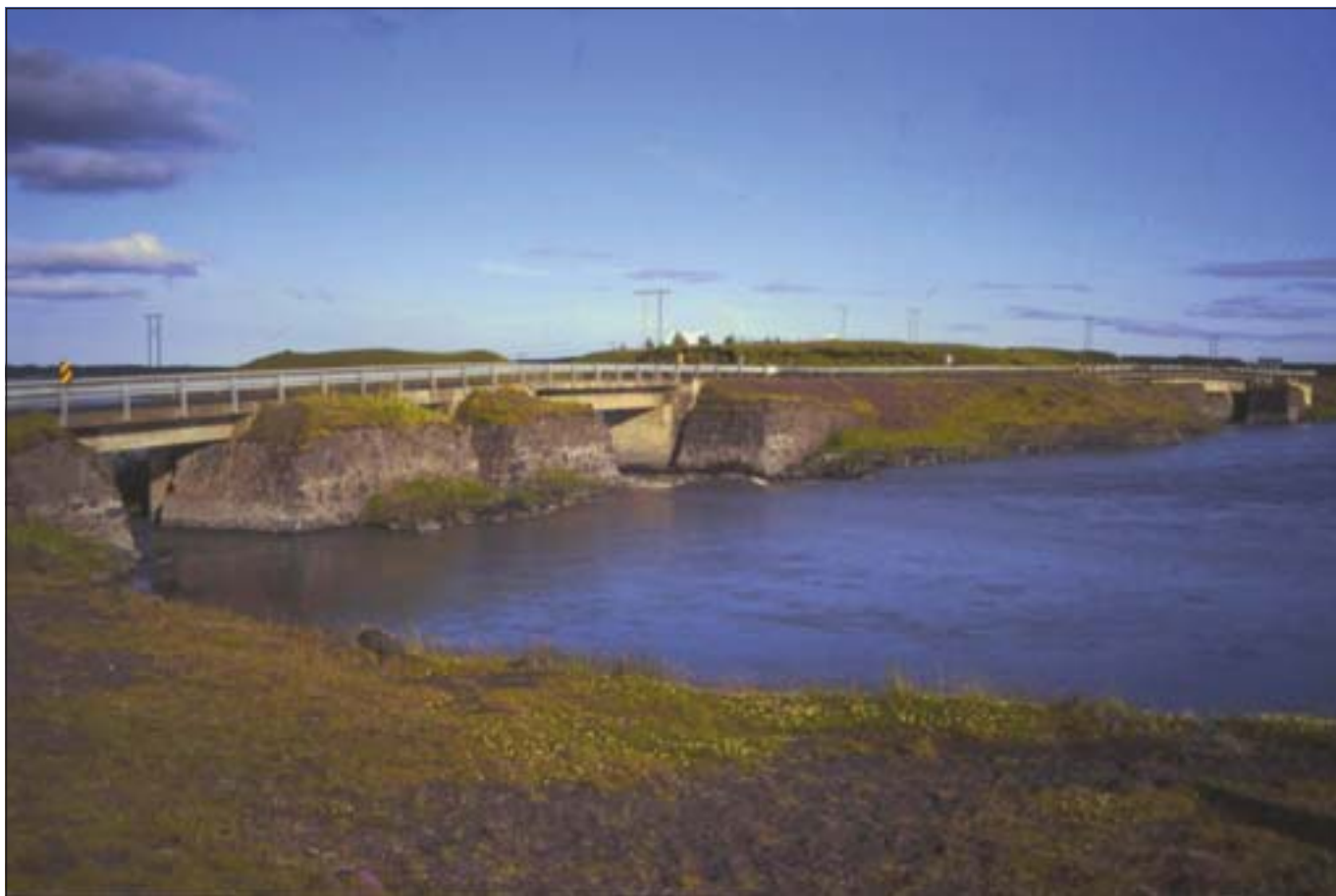
Skaftá hjá Kirkjubæjarklaustri. Brýrnar voru byggðar 1953 og eru orðnar heldur lúnar. Þær eru líka einbreiðar.