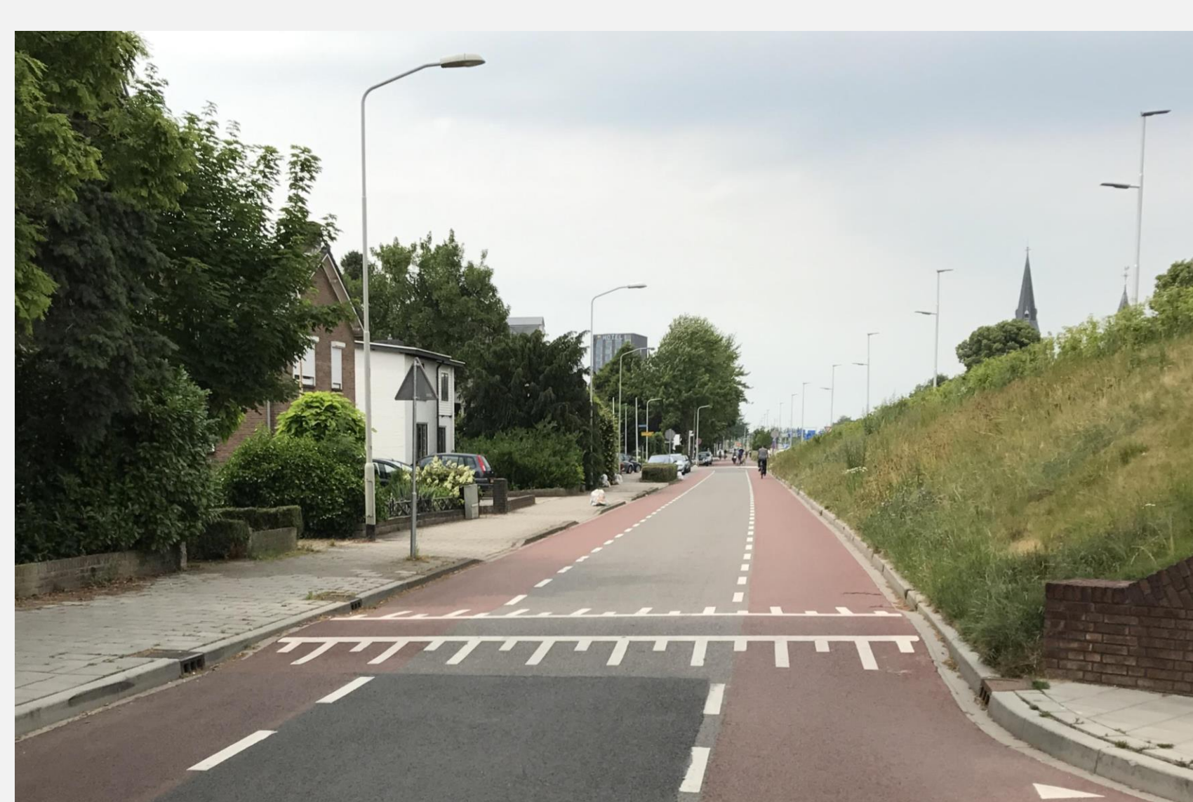
2-1 vegur í Nijmegen í Hollandi