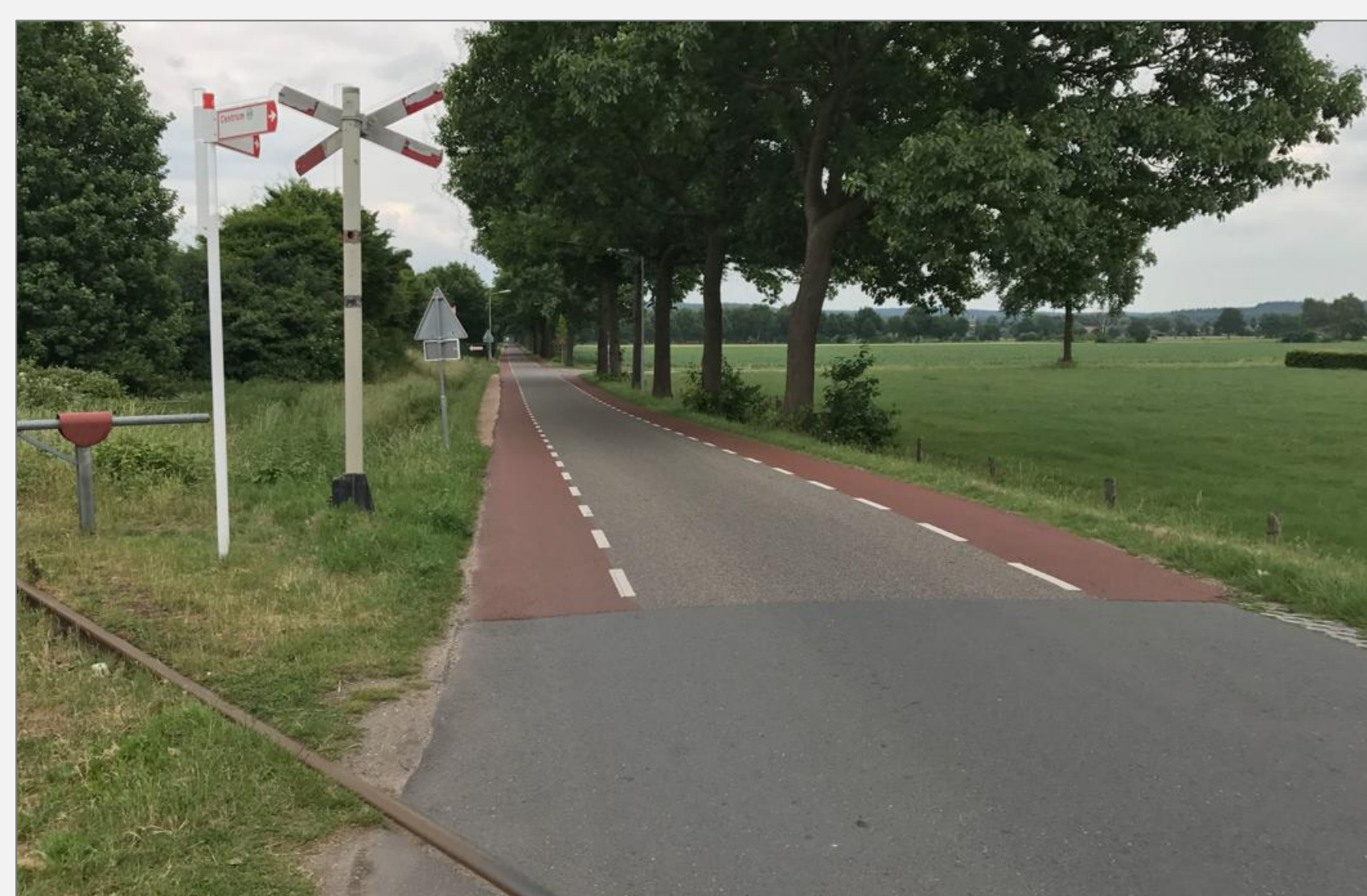
Byrjunin á 2-1 vegi rétt fyrir utan Groesbeek í Hollandi

Það eru skiptar skoðanir um ágæti 2-1 vega í Hollandi. Sumir telja að 2-1 vegir geta valdið misskilningi meðal vegfarenda þar sem ekki er um hjólaein beggja vegna götu að ræða. Þeir vilja þá frekar að hjólandi séu í blandaðri umferð með akandi ef ekki er hægt að útbúa aðgreinda hjólastíga eða hjólaeinar. Mörgum sveitarfélögum finnst þó ekki viðunandi að útbúa enga hjólainnviði og kjósa fremur að útbúa 2-1 en að láta hjól vera í blandaðri umferð á fáförnum dreifbýlisvegum.