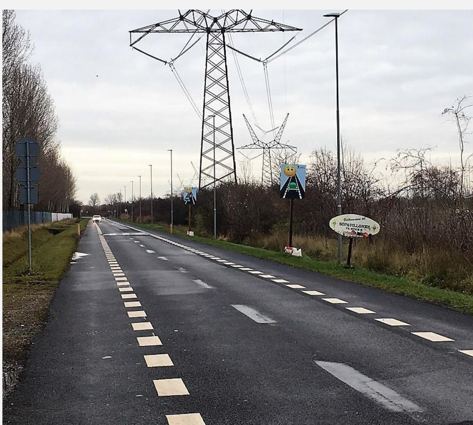
2-1 vegur í Danmörku (Cycling Embassy of Denmark)