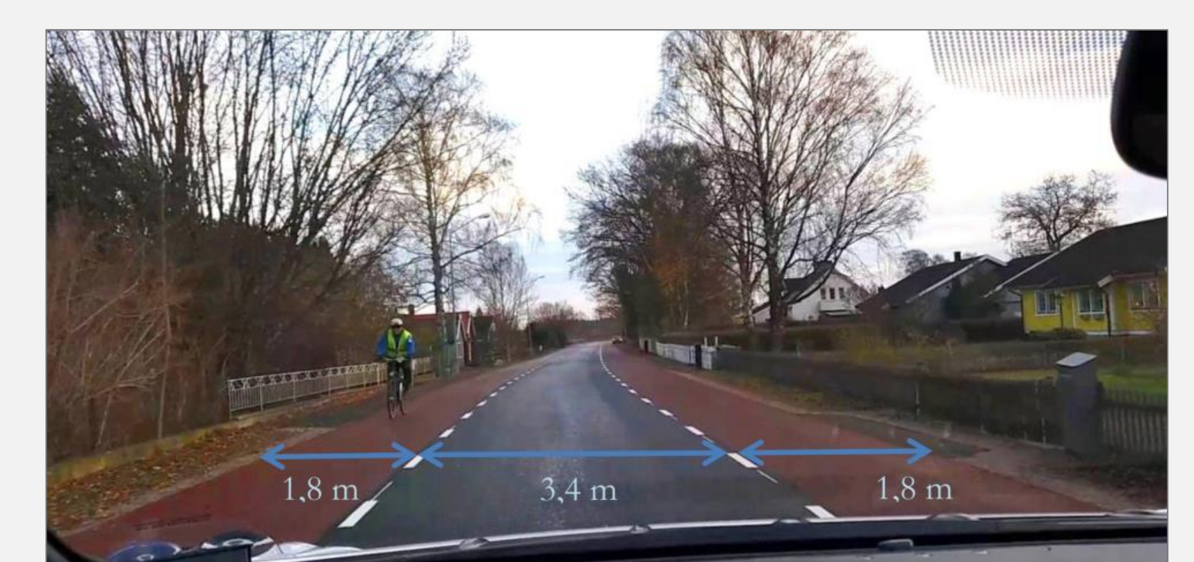
Eftir breytingu (Eidrup, Gustafsson & Kaldner, 2017)