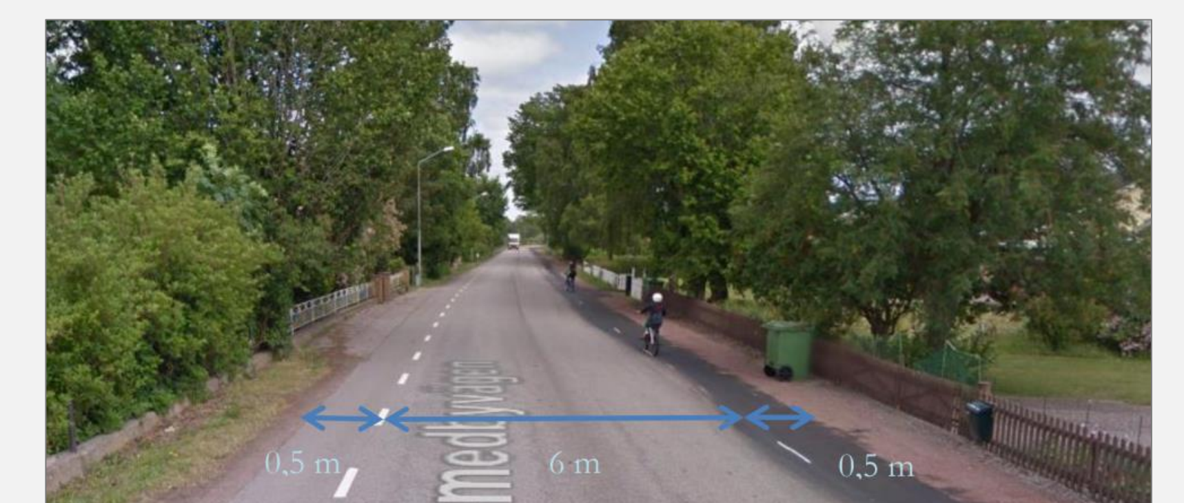
Fyrir breytingu (Eidrup, Gustafsson & Kaldner, 2017)