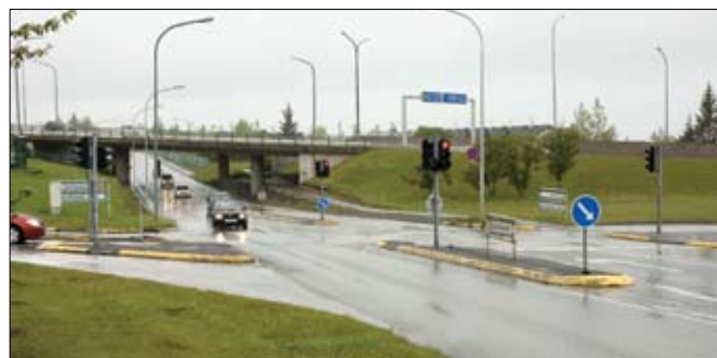
Gatnamót Nýbýlavegar og Hafnarfjarðarvegur (40). Niðurstaða útboðs á hönnun endurbóta þessara gatnamóta er birt hér að ofan.