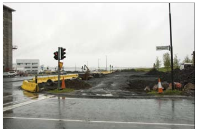
Framkvæmdir við breikkun Kleppsvegar í Reykjavík 7. júní 2006.