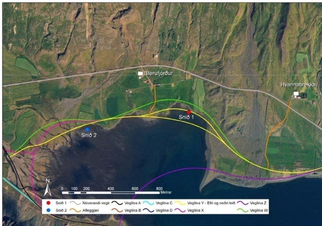
Mynd 1. Staðsetning sniða á leirum í Berufirði ásamt fyrirhuguðum veglínunum í botni Berufjarðar.