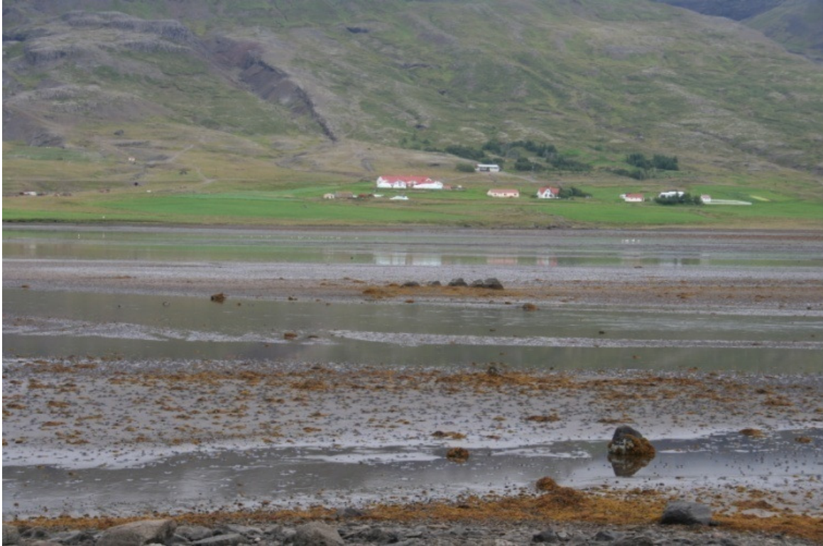
Mynd 2. Umhverfi leirunnar í Berufirði